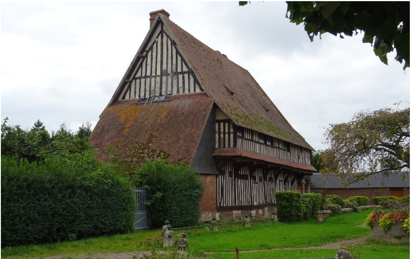
Photographie du monument historique